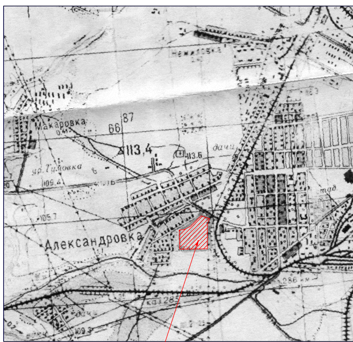
Участок, подлежащий планировке территории